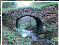
Pont entre Le Besset et Vielprat