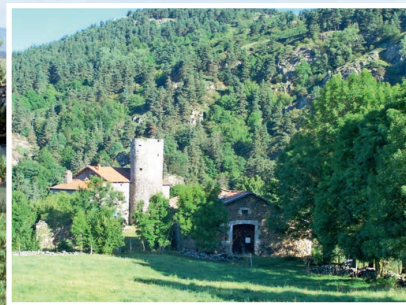
La Bastide Maison Forte de Vielprat

Continuer, passer la croix à gauche et l'église. Reprendre le chemin à droite qui ramène à la mairie.