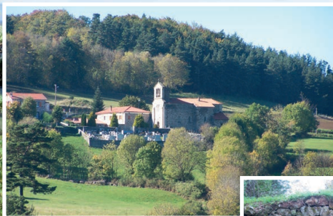
Eglise de Vielprat